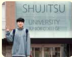
就実大学 経営学部

私は、高校3年生の1学期に岡山大学の受験を決めました。普段の学校生活では、授業だけでなく資格取得や生徒会活動にも力を入れました。生徒会での活動は自分にとって貴重な経験になったと思います。補習や面接練習は先生方のサポートが多くあったので、分からないところがあればすぐに聞きに行くようにしていました。先生方への感謝の気持ちは忘れないようにしています。大学入試に必要な共通テストの勉強では、問題の数をこなすことと復習することを大切にしていました。問題を解いて間違えたところはその日のうちに見直すように心がけました。挑戦できる環境が整っている東商で、皆さんも自分の選択肢を広げてほしいです。