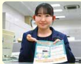
おかもやま信用金庫

自分自身のスキルを積み上げていくことが周りとの差を広げることに繋がります。進学や就職の際に自分を有利に立たせることに役立ちました。皆さんにも、様々なことに挑戦して、諦めることなく今後の進路実現に活かして欲しいと思います。