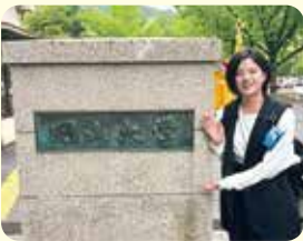
岡山大学 経済学部