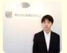
株式会社 両備システムズ

私は会計コースに所属し、商業科目を勉強する中で金融関係の仕事に就きたいという夢を持ち、資格取得に励みました。課題研究の授業では「秘書」を選択し、社会人に必要な知識やマナーを実践しながら学びました。部活動では書道部に所属し、諦めずに努力することの大切さを改めて感じ、協調性やコミュニケーション能力を身につけることができたと思います。そして、友達の影響や先生方のサポートと3年間の努力が実を結び、希望していたおかもやま信用金庫へ就職することができました。東商では多くの資格を取得でき、勉強や行事、部活動に全力で取り組むことで充実した学校生活を送ることができます。皆さんもぜひ失敗を恐れず、様々なことに挑戦してみてください。